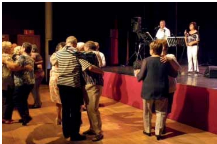
Kaffee Matinee met Goldies Road Show