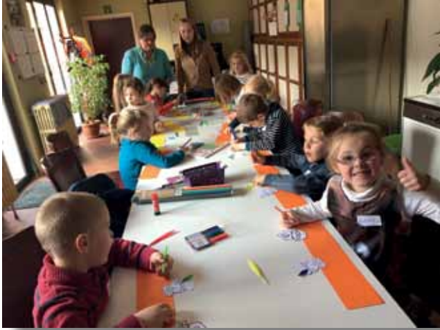
De grote voorleesnamiddag van de bib.